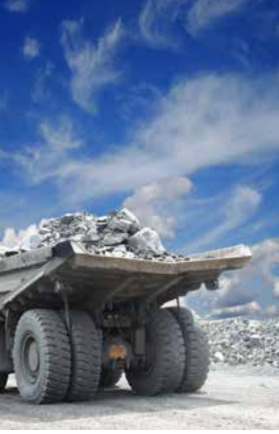
Hardox®, SSAB şirketler grubunun bir ticari markasıdır.